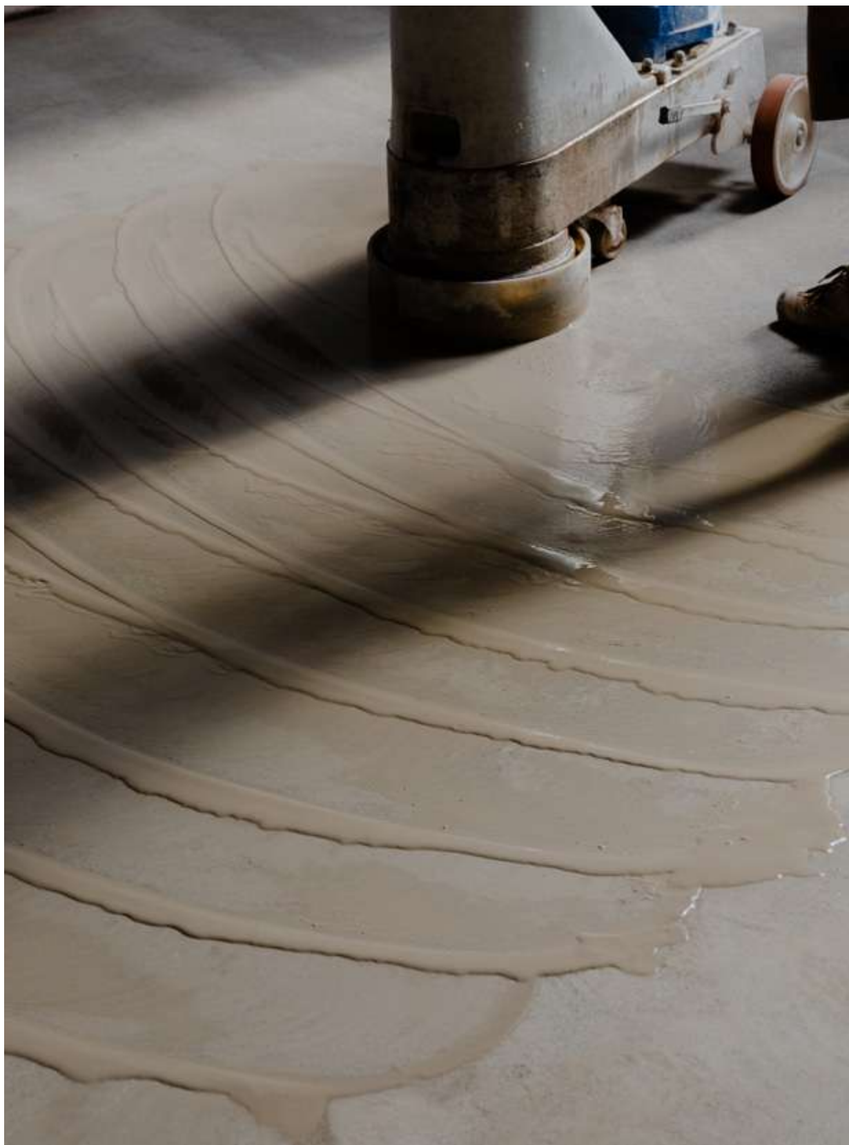
Levigatura della superficie