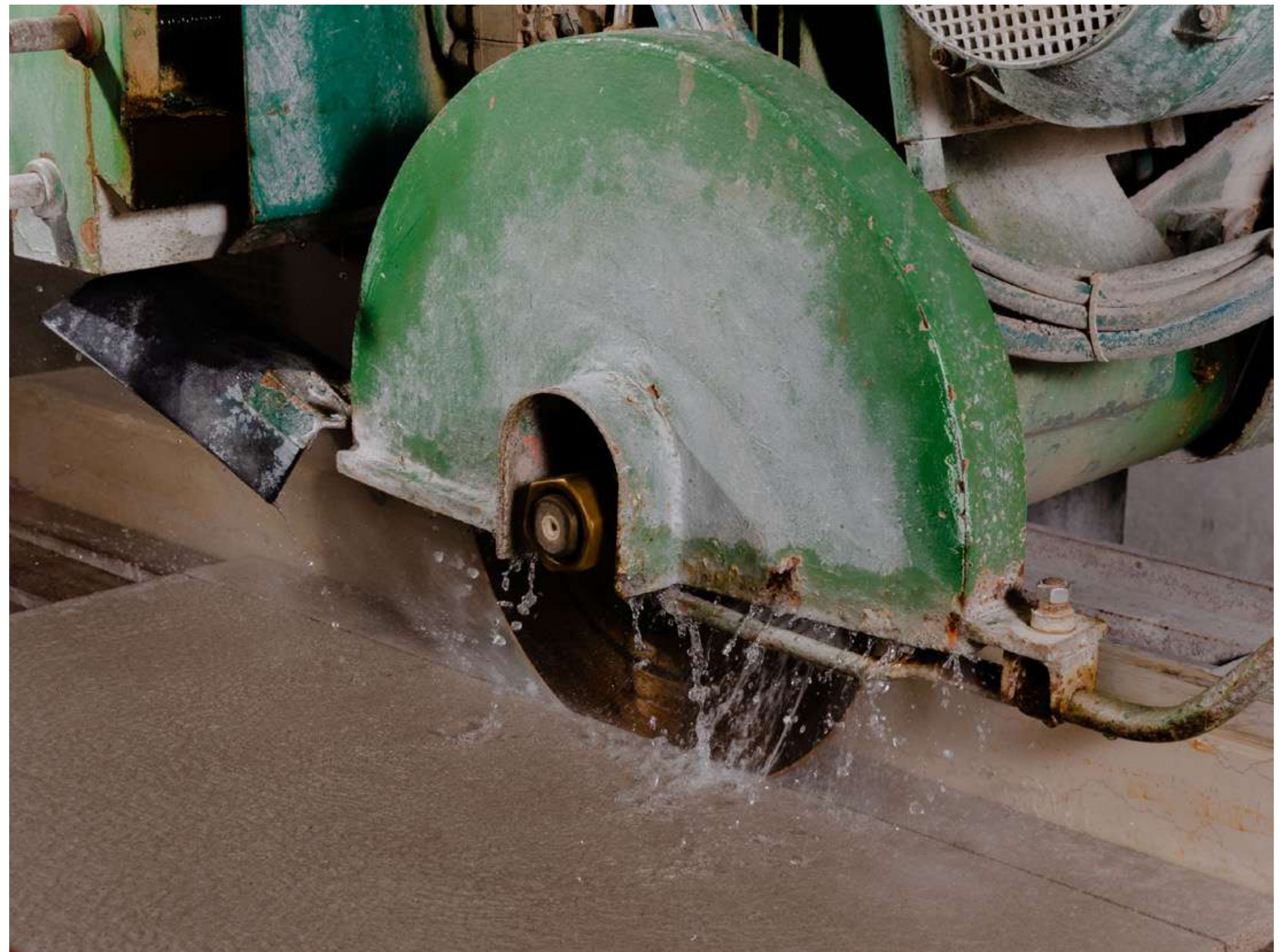
Taglio a misura per applicazioni verticali ed elementi fuori opera