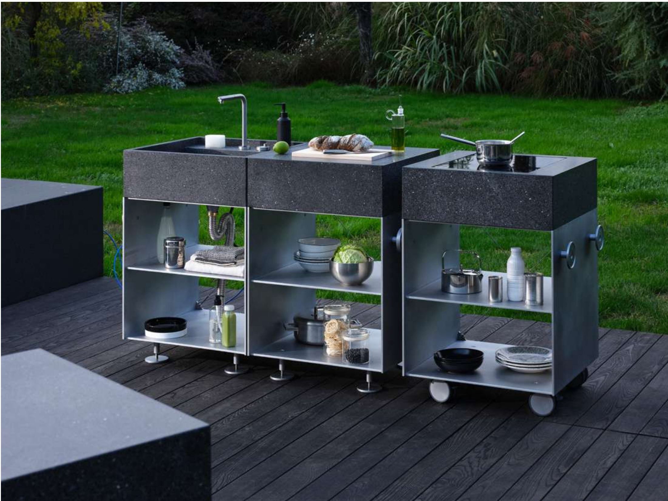
DESIGN: ENRICOMARIA TODARO

Satellite è un sistema modulare per la cucina caratterizzato da un design minimalista e funzionale. Può essere posizionato e spostato in diversi ambienti della casa, sia all'interno che all'esterno. Grazie a queste caratteristiche, si presta anche a creare zone di preparazione e cottura alternative rispetto alla cucina principale.