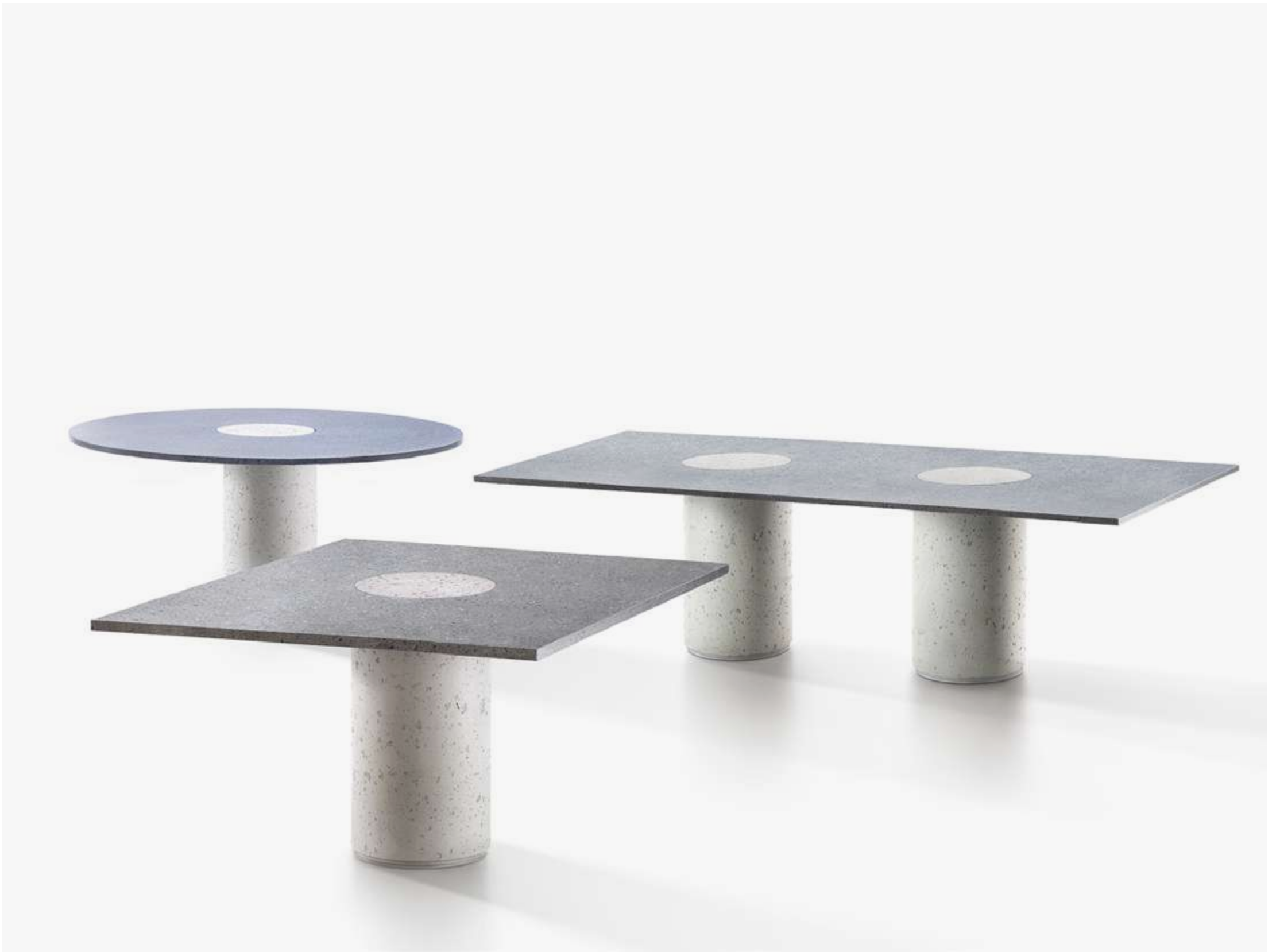
DESIGN: ENRICOMARIA TODARO

Atollo è una collezione di tavoli ispirata all'emersione della materia, che sembra affiorare silenziosamente dalle profondità marine per dare vita a un'architettura naturale.