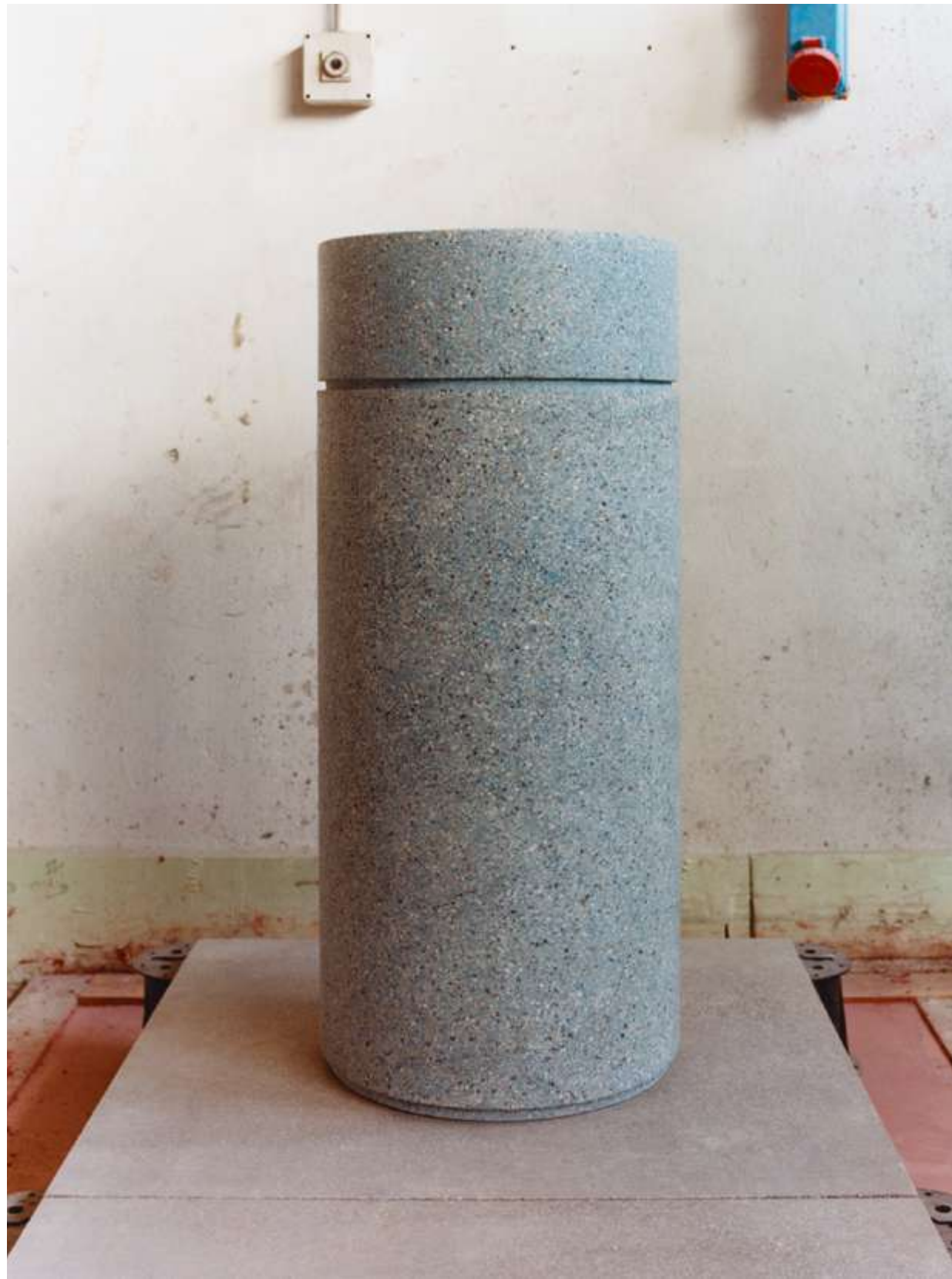
DESIGN: ENRICOMARIA TODARO

Linee squadrate, forme curve, elementi essenziali: il nome riferisce all'elemento imprescindibile di un'architettura. Una gamma di 8 lavabi monoblocco, da appoggio o freestanding, che esprime la filosofia di 70Materia: funzionale e dall'estetica ricercata, pensata per durare nel tempo.