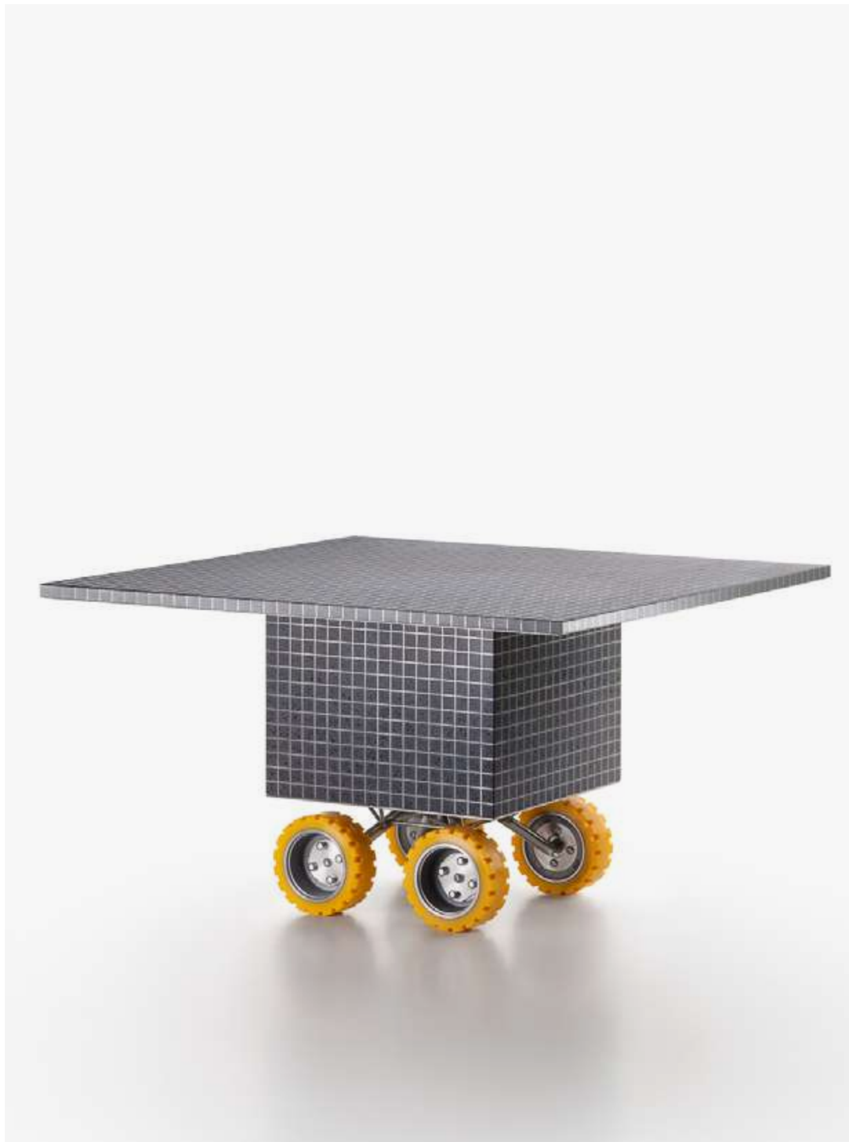
SG ROVER TABLE DESIGN: CARA\DAVIDE