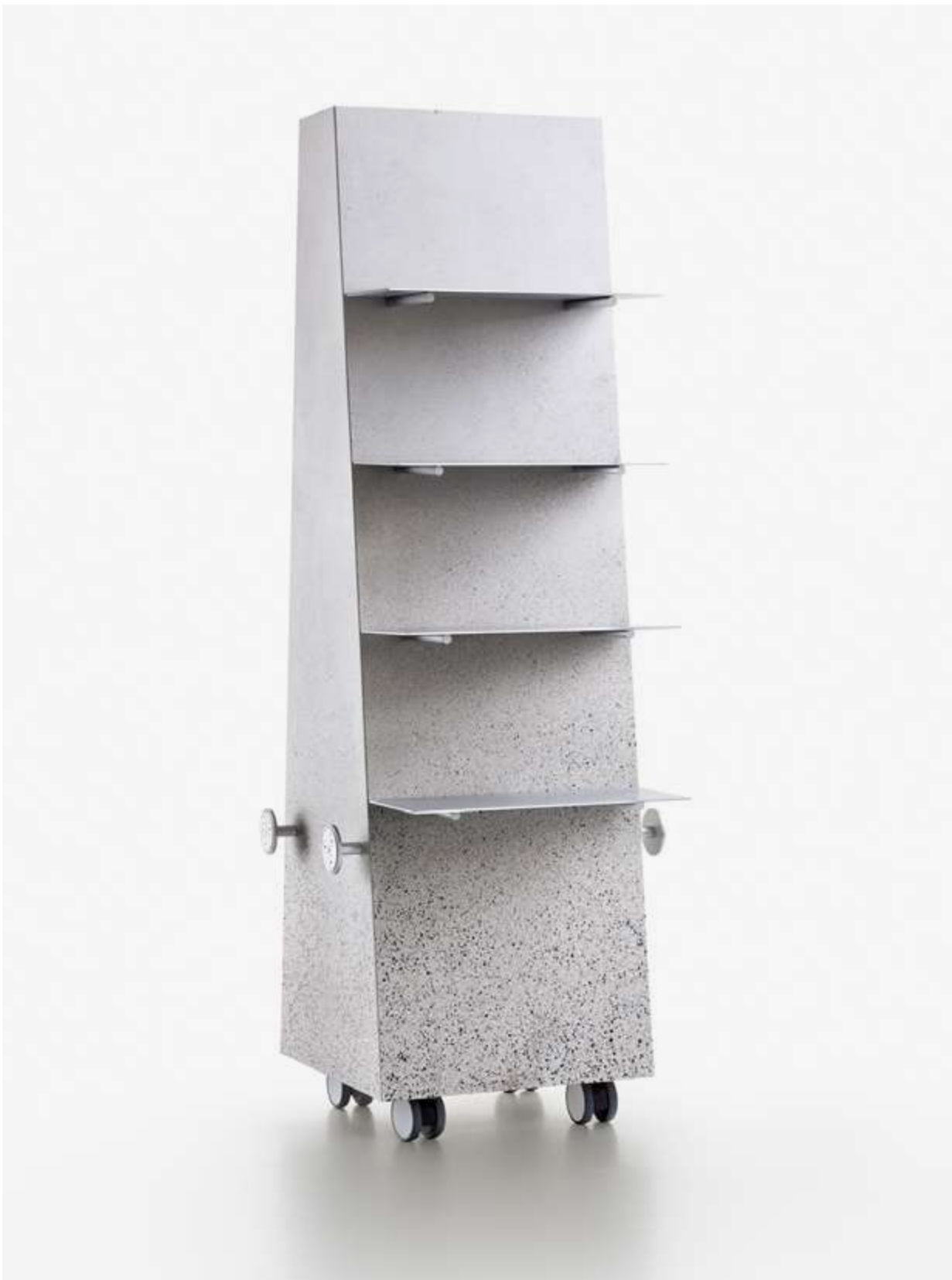
ODISSEA SPAZIALE DESIGN: FINEMATERIA