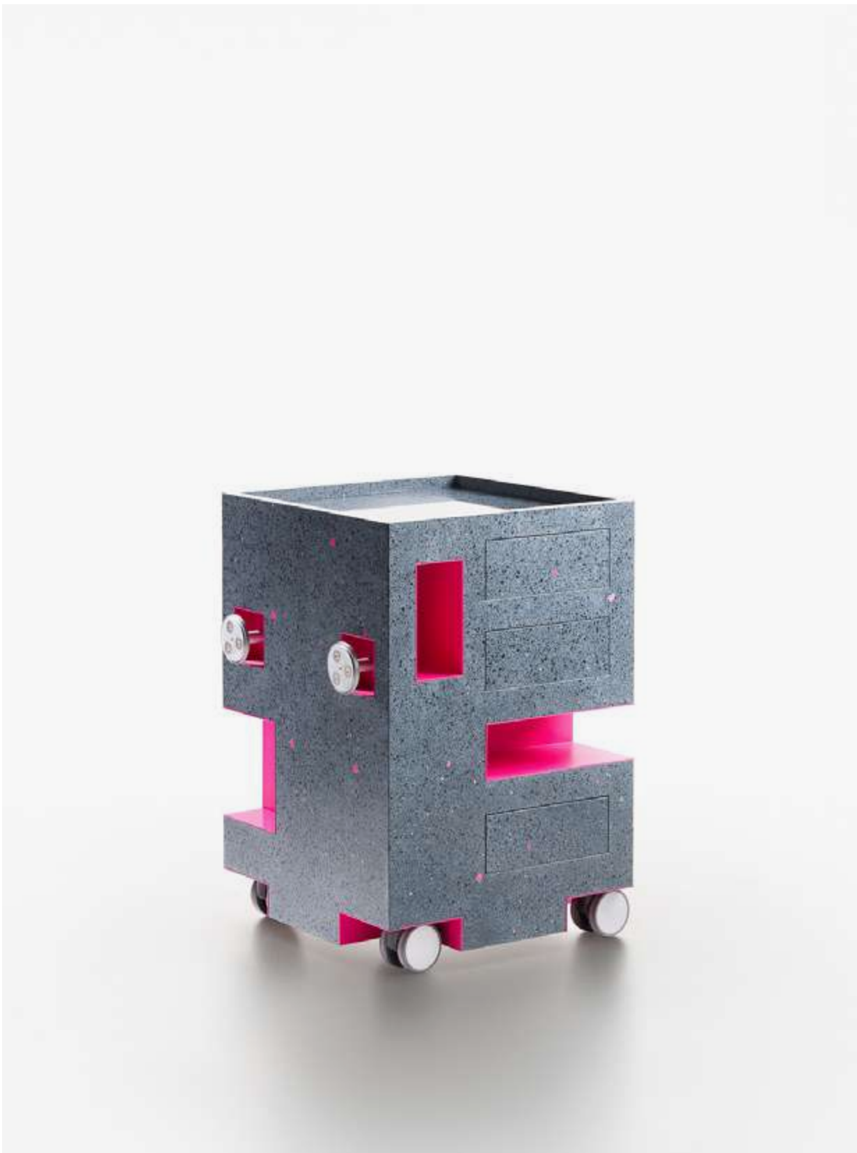
TIER DESIGN: GROOVIDO

Orbita è un progetto sperimentale che sviluppa nuove traiettorie di ricerca per Satellite, il sistema modulare per la cucina di 70Materia. Partendo dal design essenziale e dalle superfici di 70Materia, Orbita si spinge oltre i confini estetici e funzionali di Satellite, in collaborazione con designer emergenti e protagonisti del contemporaneo.