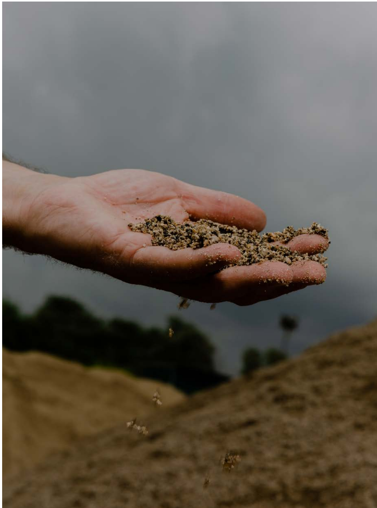
Reperimento della sabbia