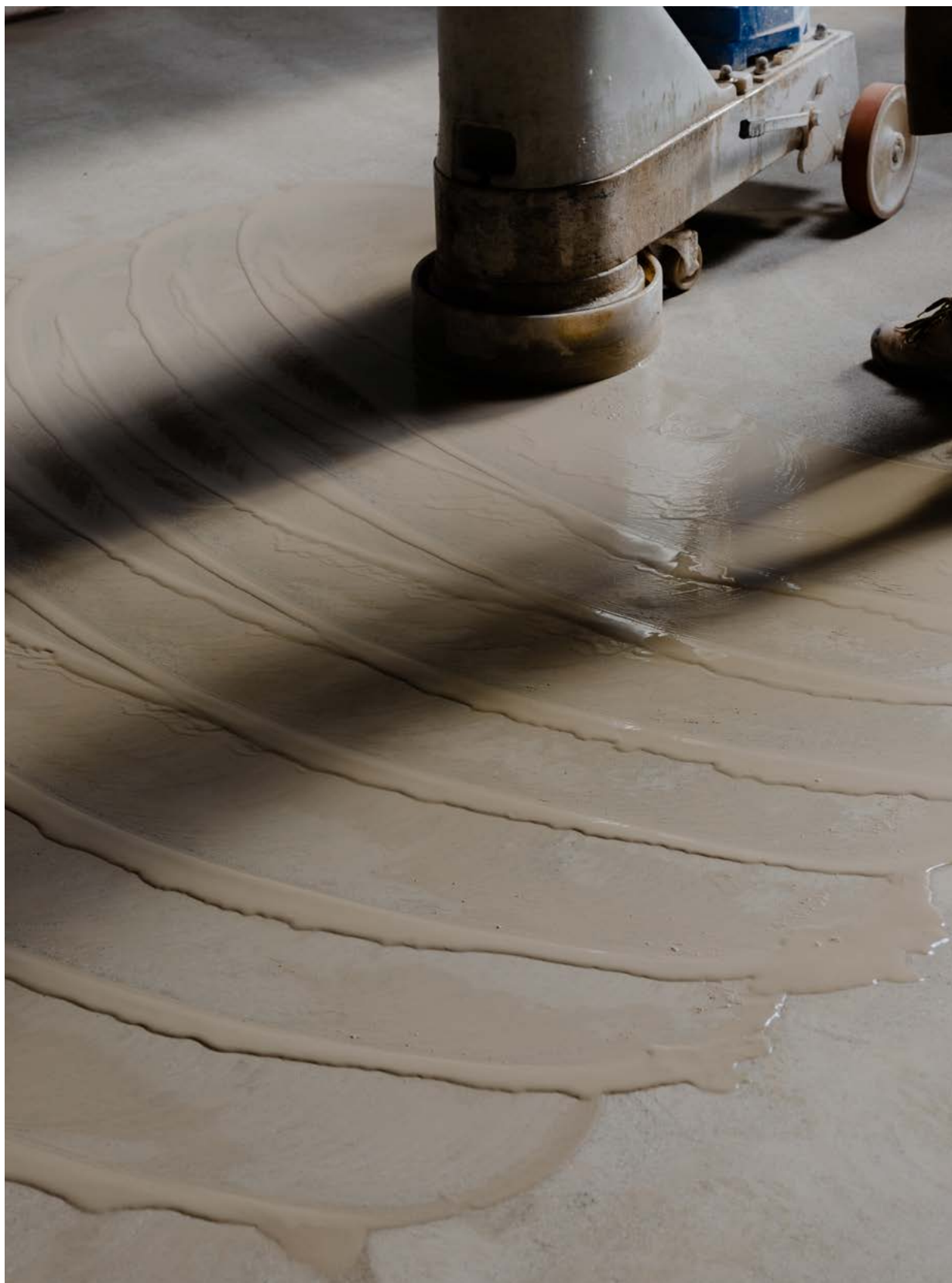
Levigatura della superficie