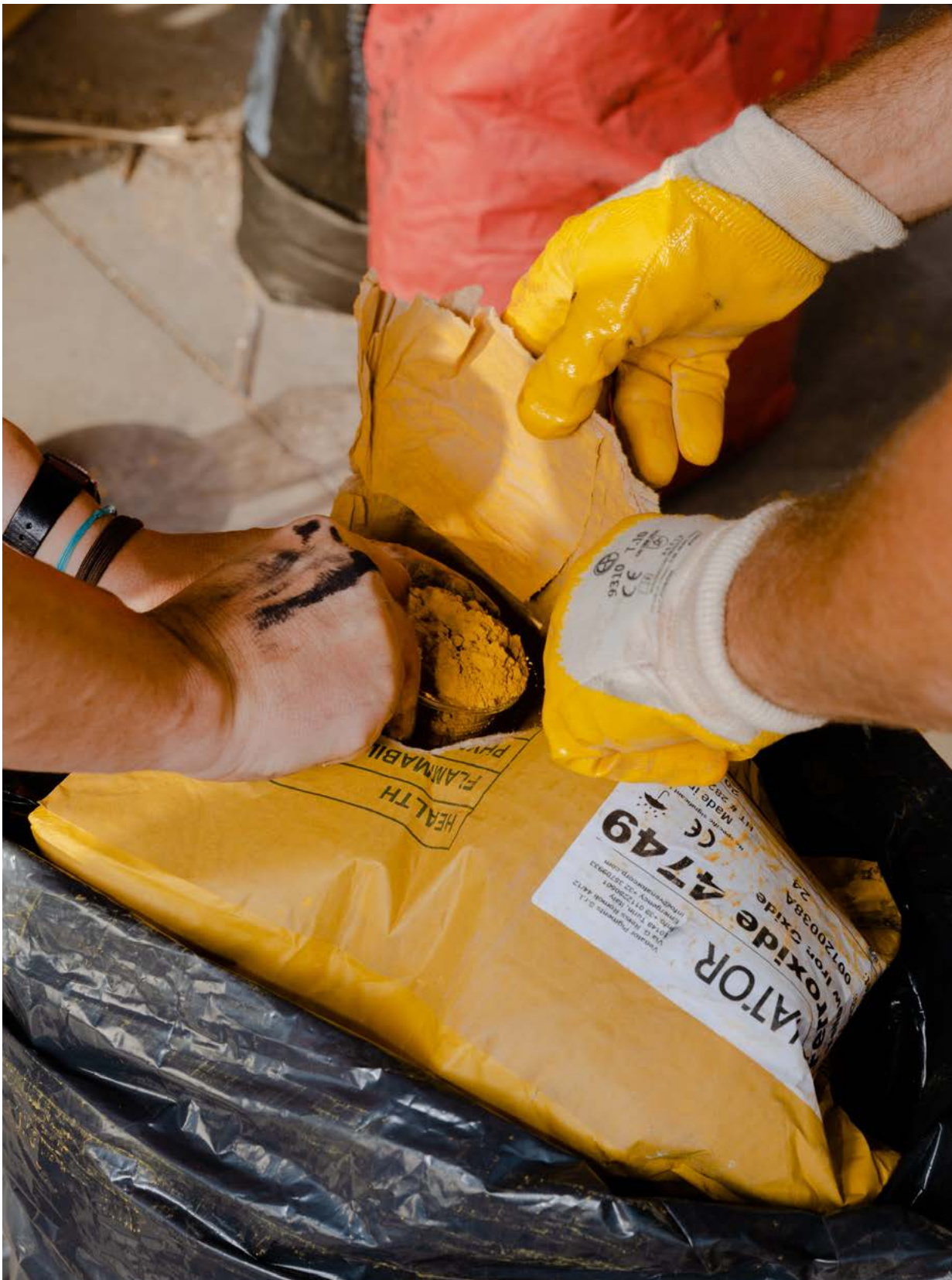
Aggiunta di ossidi