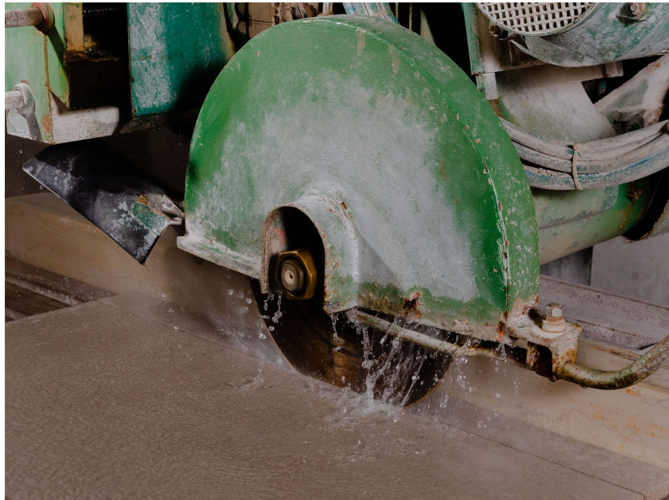
Taglio a misura per applicazioni verticali ed elementi fuori opera